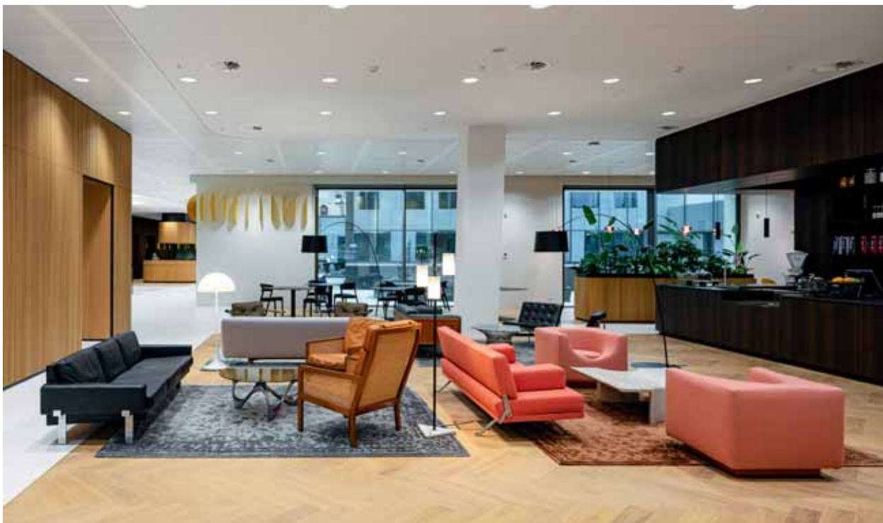
FOTO BOVEN Powerhouse Company gebruikte hoogwaardige, natuurlijke materialen die voor zichzelf spreken. Zo is in het restaurant op de eerste verdieping grijs marmertoegepast.

De toegepaste kleuren zijn verbonden aan de functies, waarbij onderscheid is gemaakt in ontvangen, ontmoeten, focus en gastvrijheid. Vos: “Op de werkvloeren hebben we gekozen voor rustgevend groen, in de restaurants voor warmere tinten.” In